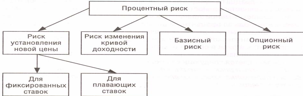
Рис. 1.2. Формы процентного риска