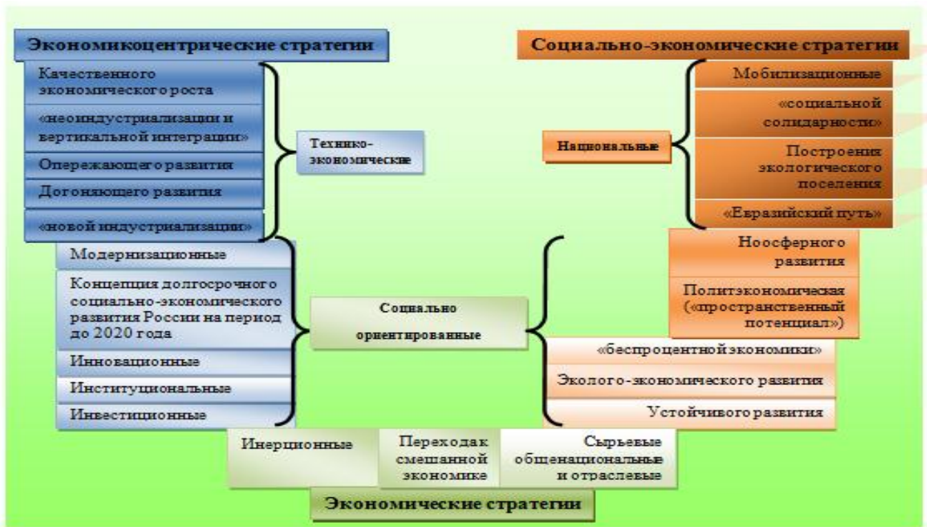
Рис. 3. Классификация национально-государственных стратегий на основании их выбора

лении места и роли экономики в обеспечении высокого качества жизни: или как центра и ведущего звена, подобно экономике развитых стран, или как средства и инструмента развития социальной, культурной, образовательной и других сфер. Это позволило выявить два полюса в классификации экономических стратегий (рис. 3).