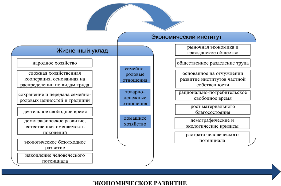
Рис. 2. Трансформация жизненных укладов в экономические институты

Характер хозяйственной деятельности человека, опосредованный естественно-природными и культурно-историческими факторами и формирующий семейно-родовые и общественные отношения, выражающие его родовую сущность , представляет собой жизненный уклад (рис. 2). В России сохранились семейно-родовые уклады, определявшие в 1950-е годы жизнь большинства населения. 19